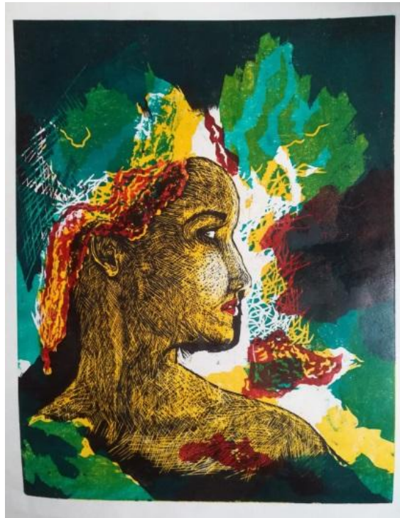
Ακόμα ψάχνω εσένα