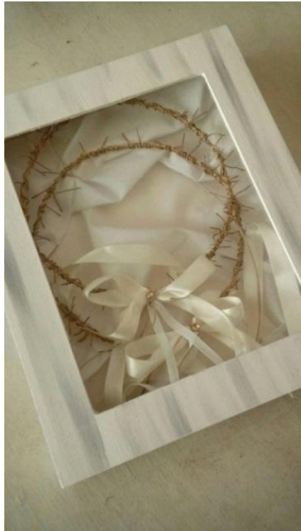
Μείζων δε τούτων η αγάπη