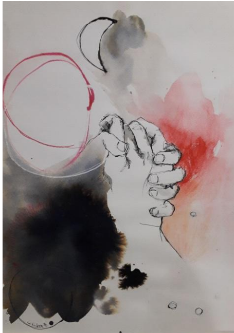
Μείζων δε τούτων η Αγάπη