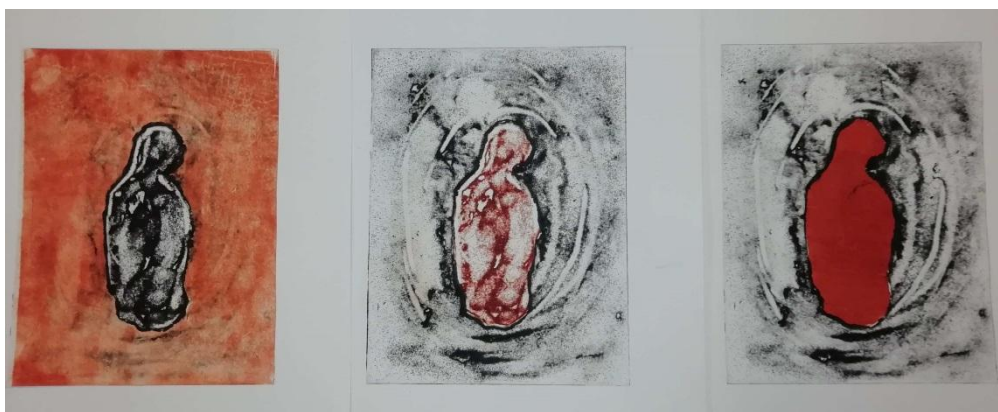
Αγάπην δε μη έχω, γέγονα χαλκός ηχών, ουδέ ειμί - Άρτι γινώσκω εκ μέρους Και το τελευταίο - Μείζων δε τούτων η αγάπη