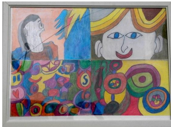
Το μυστήριο της αγάπης